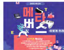
진로활동 <창의성과 혁신>