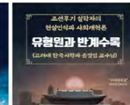
학생들이 선호하는 진로 특강