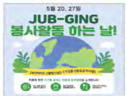
봉사활동 <공동체 및 사회적 감수성>